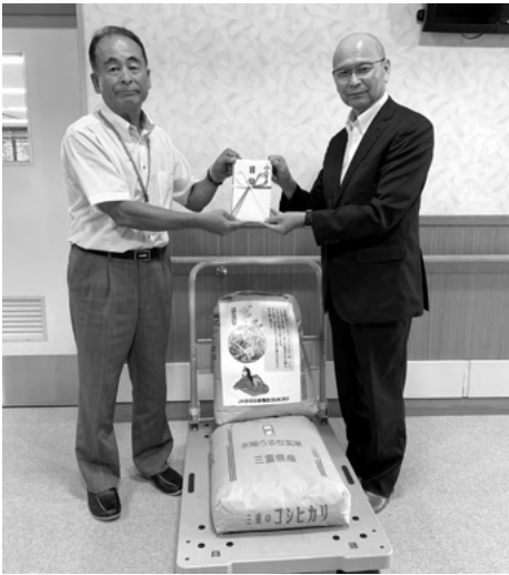
JA多気郡農協様から新米の寄贈

令和元年9月4日(水)にJA多気郡農協様から新米の寄贈がございました。頂戴いたしました新米は高齢者給食サービスのお弁当に使わせていただきます。ありがとうございました。