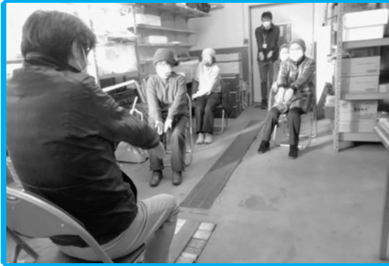
生活支援体制整備事業 高齢者の生活支援と 介護予防事業（海ものがたり）