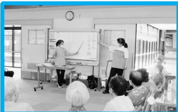
通所介護事業所 レクリエーションの様子