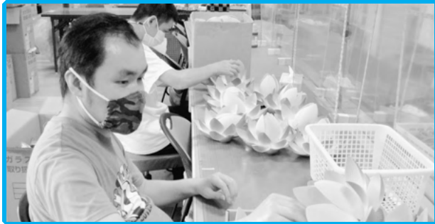
◀ジグソー工場 下請け作業の様子