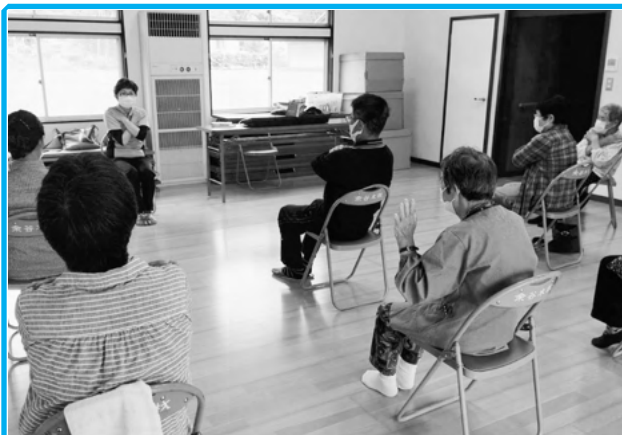
◀ 出前介護予防教室