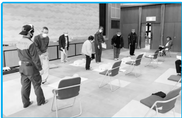
◀ 家族介護教室事業 一般救急法の講習会