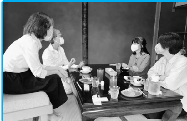
◀ 家族介護者交流事業 Cute.mukuriの座談会