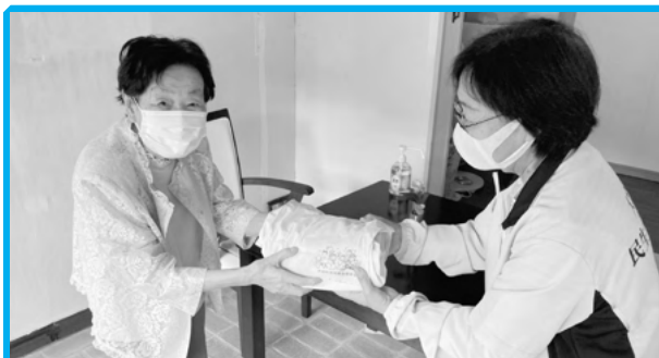
◀給食サービス事業 代替事業として災害用物品を配布

(1) 給食・配食サービス事業の実施状況 対象：一人暮らし高齢者(80歳以上)・高齢世帯(80歳以上) 配食数：大台地区 3回/月(151食)・宮川地区 1回/週(153食)