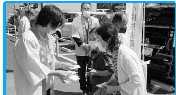
◀共同募金活動 道の駅にて街頭募金活動