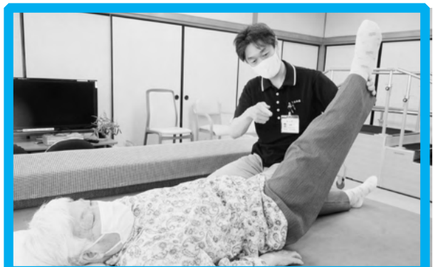
通所介護事業所 個別機能訓練の様子