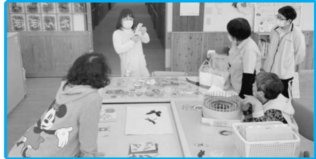
◀知的障がい者デイサービス