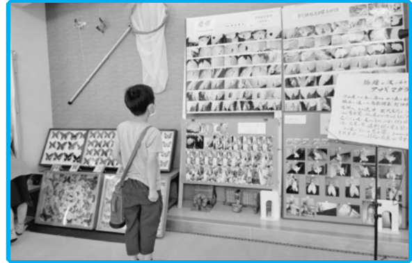
生活支援体制整備事業 みんなのギャラリー（宮川支所）