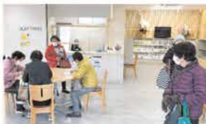
(買い物後、奥伊勢テラスにて)