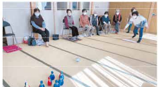
おかめ会(神滝)の様子