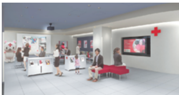
日本赤十字社三重県支部社屋・災害救護支援センター (令和6年度中竣工)